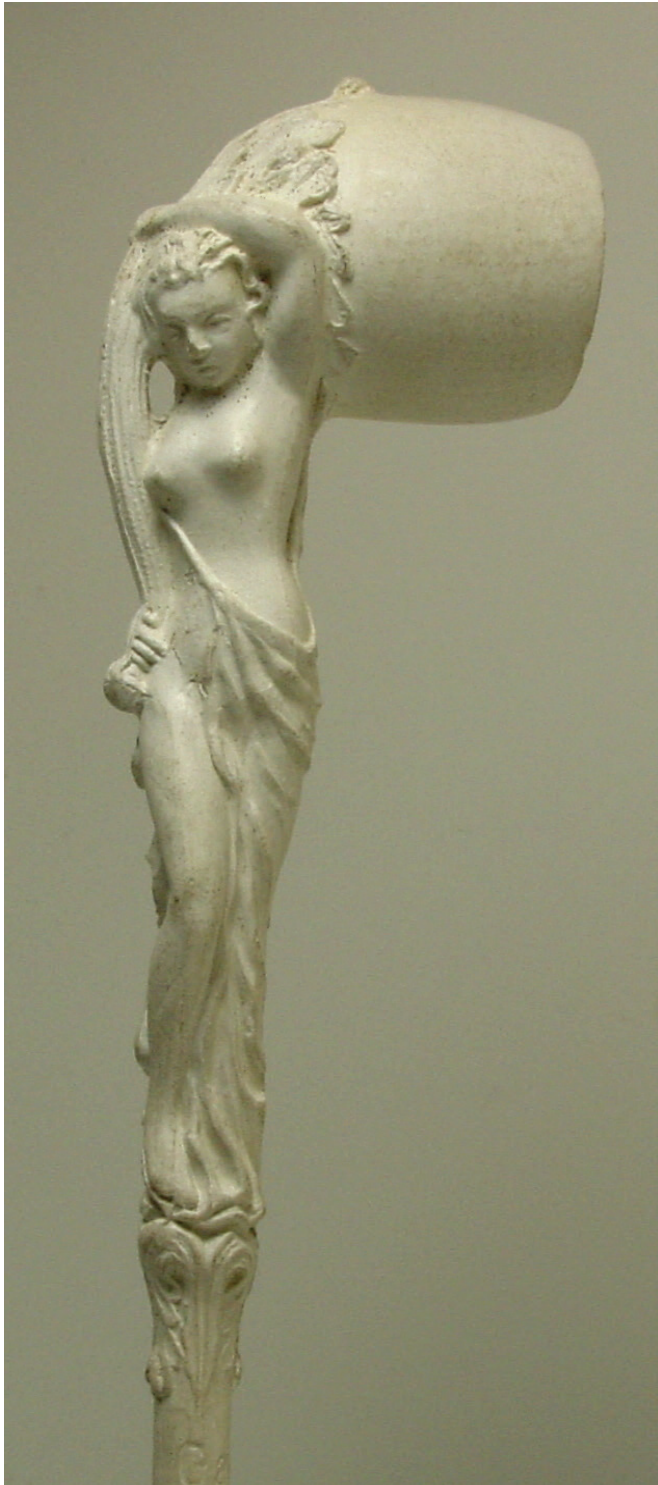
Afb. 6. Flore, nummer 1267. Collectie en foto auteur.