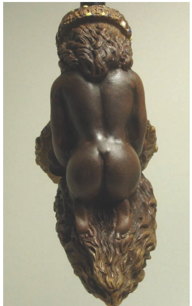
Afb. 4a-b. Nana Saïb, Gambier, nummer 696.