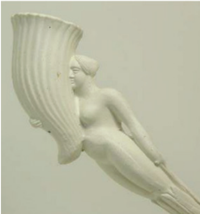
Afb. 3a. Pijp met cornucopiavormige ketel. Bodemvondst Givet. Collectie Messin, Givet, Frankrijk.