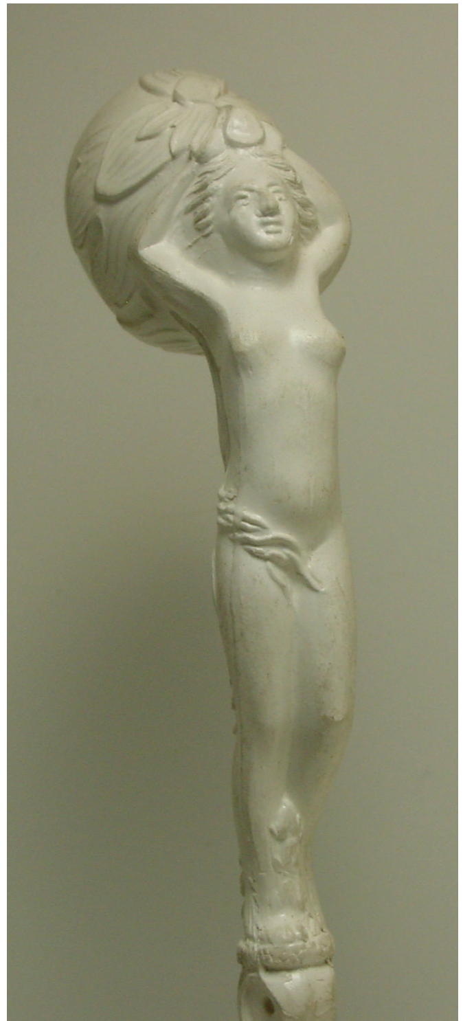
Afb. 5. Cariatide, nummer 1264. Gambier, Givet.

Van de in dit artikel omschreven modellen zijn de Cariatide en Flore de enige die lang in productie zijn gebleven. Dit in tegenstelling tot alle andere voorgaande modellen. Ze worden in vier Gambiercatalogi getoond,