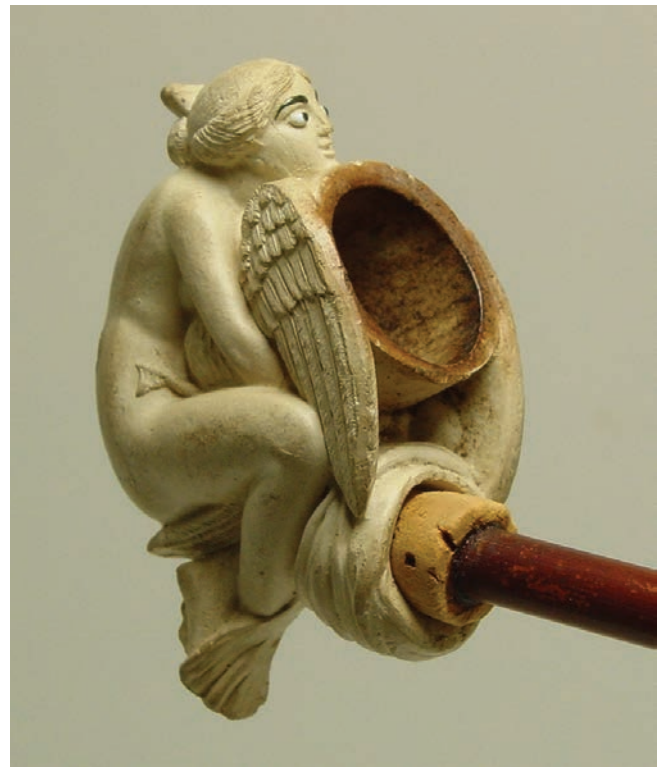
Afb. 1c. Léda et le Cygne.

Een aantal pijpen waarin vrouwelijk naakt verwerkt is in het ontwerp wil ik hier graag belichten. Het gaat om