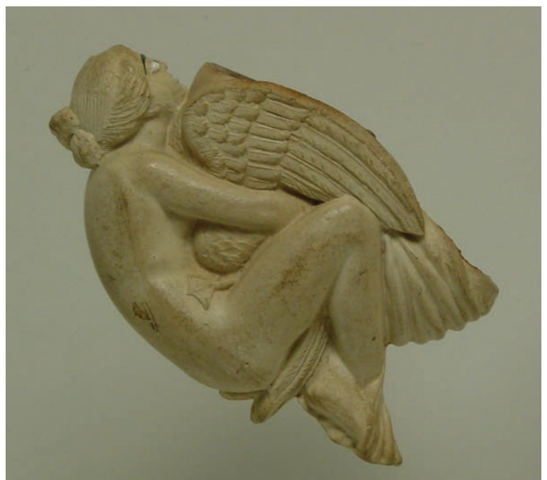
Afb. 1a-b. Léda et le Cygne.